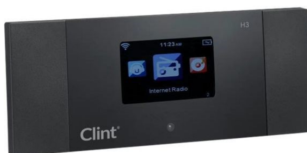
Clint H3 set til 799 kr. på nettet