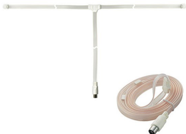
FM stueantenne set til 29 kr. på nettet

Det kan gøres til rimelige priser, og du kan se eksempler på side 5.