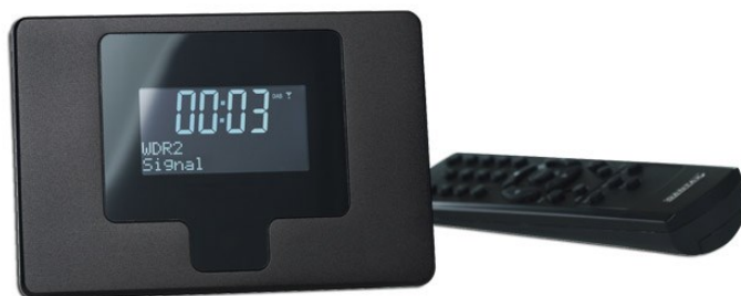
Scansonic D-100 DAB+ radio tuner set til 699 kr. på nettet

D100 er et lækkert radio panel fra Scansonic i høj kvalitet og lækkert finish, som kan tilsluttes eksisterende anlæg. Radio'en fås i 2 udgaver, denne DAB+ radio og en Internet radio med indbygget mediaafspiller; begge i samme flotte alu-design, diskret uden noget logo, så det passer til alt andet udstyr.