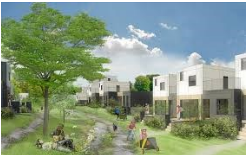
Sådan ser illustrationen for de kommende boliger i Rådhuslunden ud. (Bjerg arkitektur)

Den ny udstykning ved Dyvelåsen samt Kongeskrænten i Kong Svends området vil også blive tilbudt tilslutning til Smørum Kabelnet.