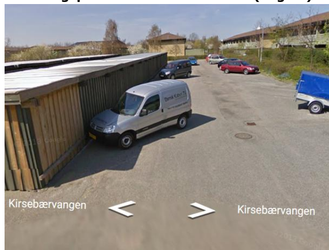
POP nr. 6 Parkeringsplads ved Kirsebærhaven (bagest)