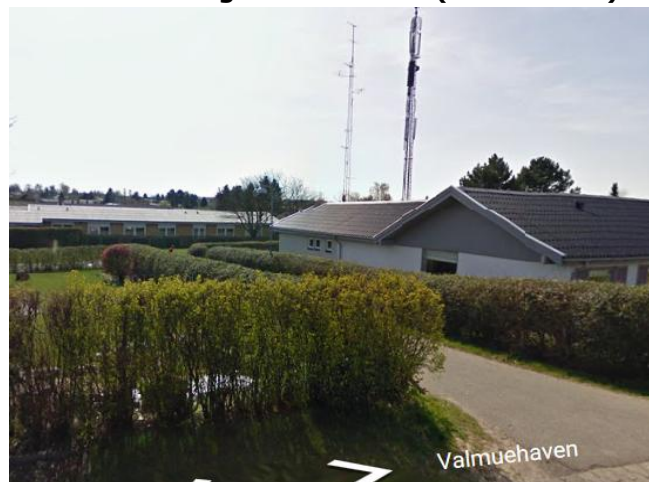
POP nr. 8 og 9 Sti ml. Riskær og Valmuehaven (Ved masten)