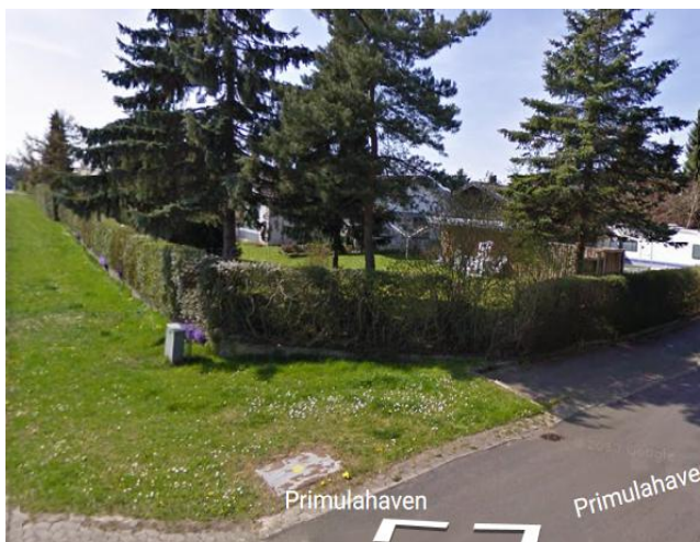
POP nr. 5 Primulahaven