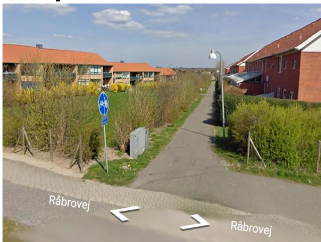
POP nr. 7 Råbrovej